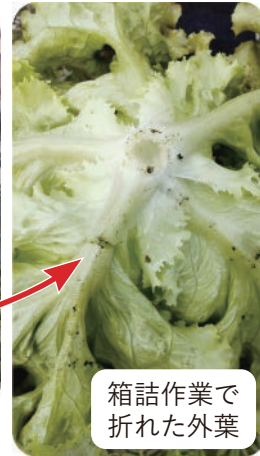
箱詰作業で折れた外葉