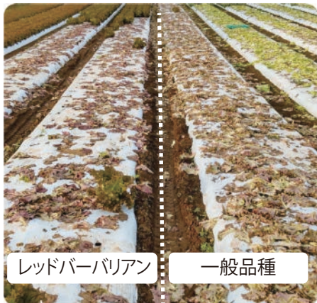
レッドバーバリアン