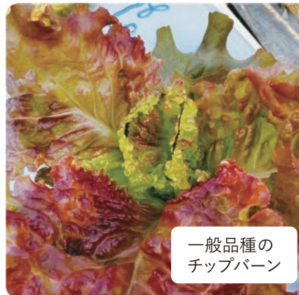
一般品種の チップバーン