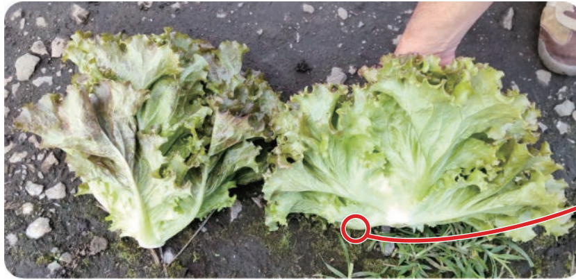
レッドバーバリアン